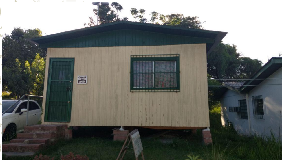
Chalé da Cultura