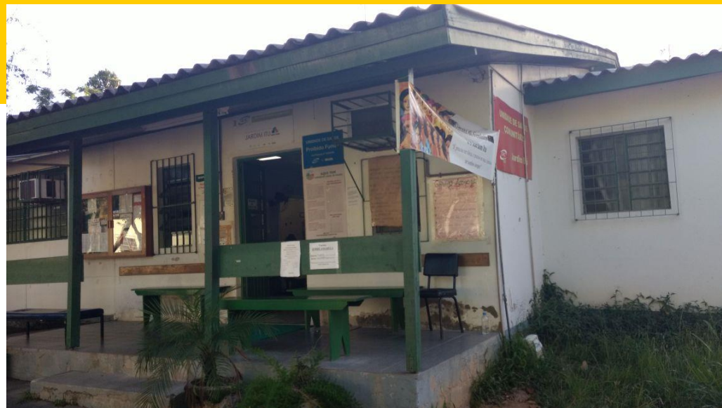
UBS Jardim Itu