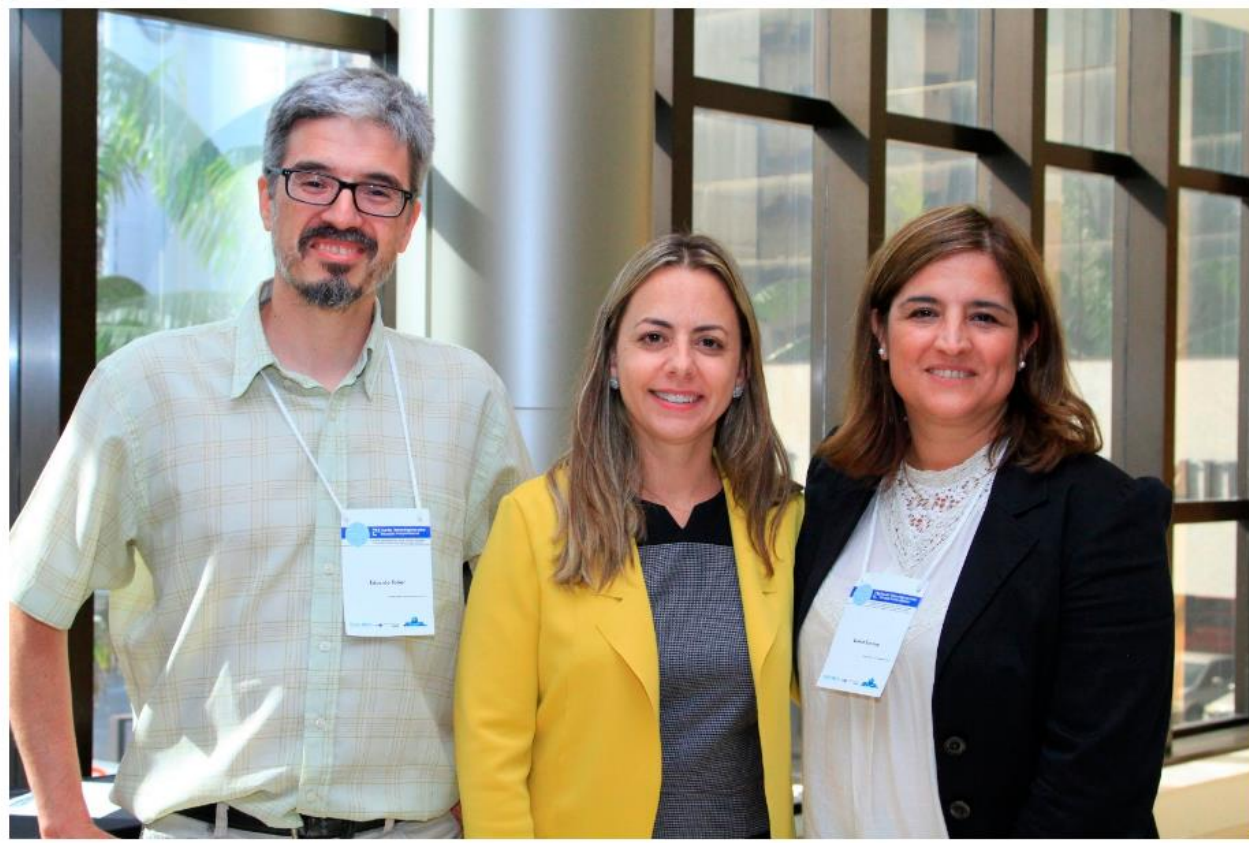
Representantes de Chile, Brasil y Argentina durante la ceremonia de constitución de la Red Regional de Educación Interprofesional de las Américas (REIP).